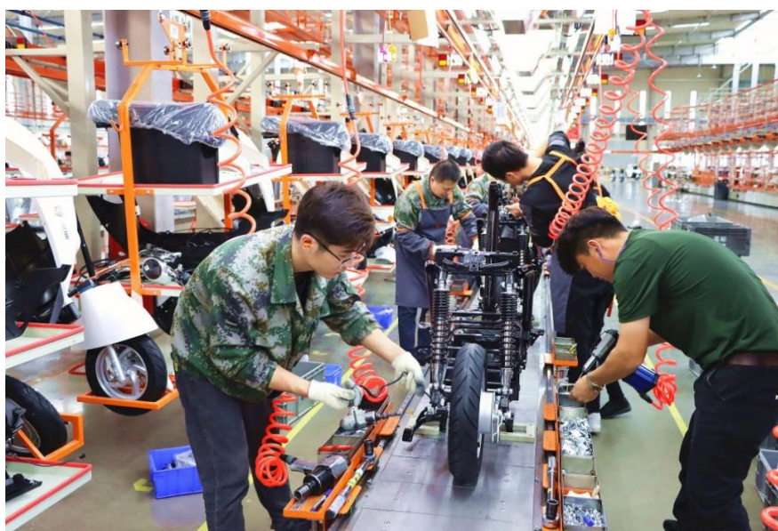
图 16 岗课融合

以实地体验、工学交替和岗位实习为依托，帮助学生了解职业发展的多样性，培养学生的职业认知和规划意识，提高职业素养和就业竞争力。皖西经济技术学校利用合作契机积极申报省级职业启蒙教育系列项目 3 个：职业体验中心（现代装备制造职业体验中心）、职业启蒙教师团队（康养旅游服务职业启蒙教师团队）、职业启蒙（体验）课程（古楚之韵——青铜纹饰再创作），为中小學生提供多样的职业启蒙教育和成长实践体验。2025 年全市中等职业学校开展职业启蒙教育 80 余场，接受教育人数达 1100 余人，同时不定期组织化工、汽修、服装等专业学生到企业开展职业体验教育。