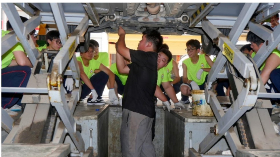
图 9 汽车运用与维修专业学生实习实训

充分发挥智力和人才优势，深度融入区域产业体系，积极与工业园区构建“园中校、校中厂”合作格局，协同开展现代学徒制与订单培养，形成了“专业与产业、教室与车间、育人与育才三合一”的产教融合育人新模式。2025 年，六安市中等职业学校聘请行业导师 290 人，聘请大国工匠、劳动模范 5 人。组织赴企业挂职锻炼教师 100 人、教师进厂授课 400 余次、企业员工进校授课 1000 余次、参与订单（定向）班 7 个，订单（定向）学生 300 余人，霍山职业学校与迎驾集团合作的“订单班”定向输送 50 名专业人才。全市建有校企共建实训基地 59 个、校企共建专业 114 个、“校中厂” 9 个，虚拟仿真实训基地 4 个。统一组织校内学生赴省内外企业开展实习，全市职业院校赴企实习学生超过 1.6 万人次。