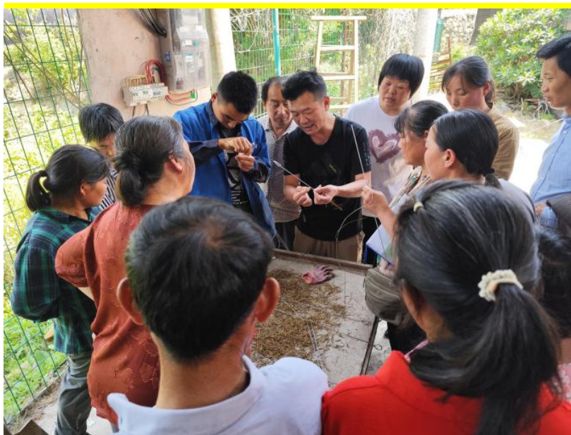
图 13 霍山职业学校开展中药炮制技术培训