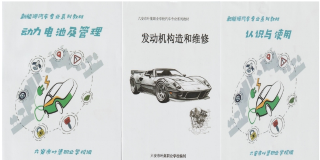
图 6 叶集职业学校新编写新能源汽修专业校本教材