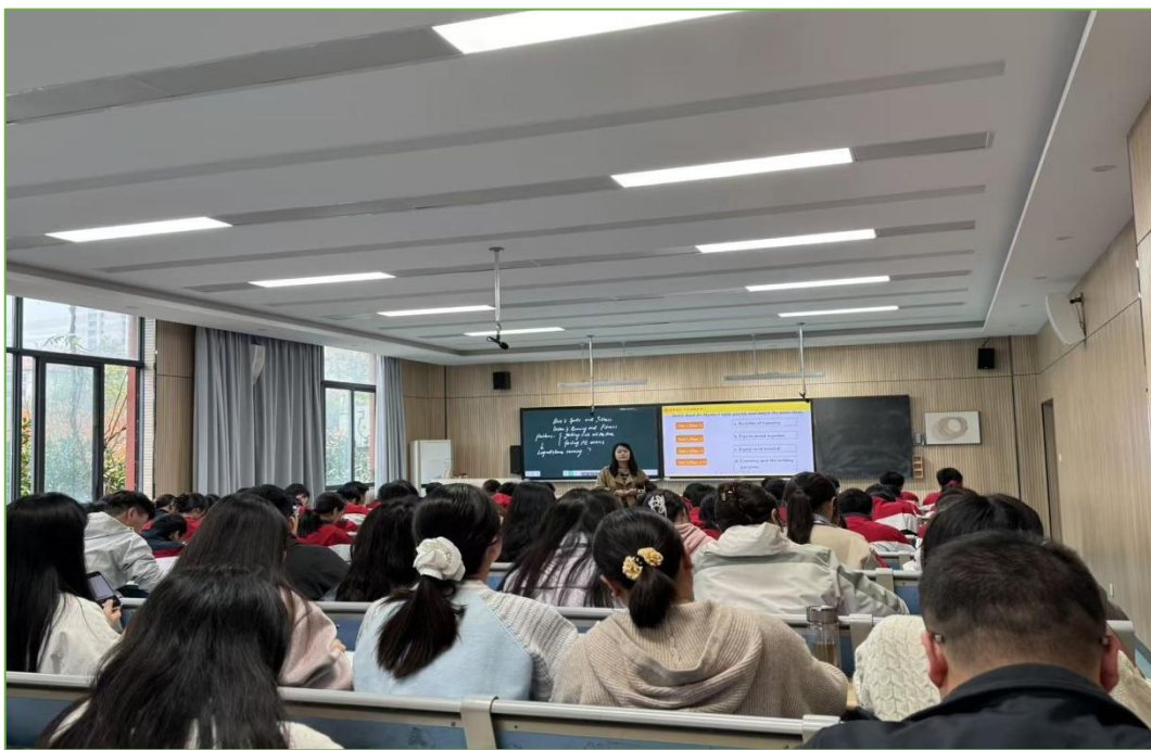
图 3 霍邱师范学校与霍邱二中联合开展同课异构活动