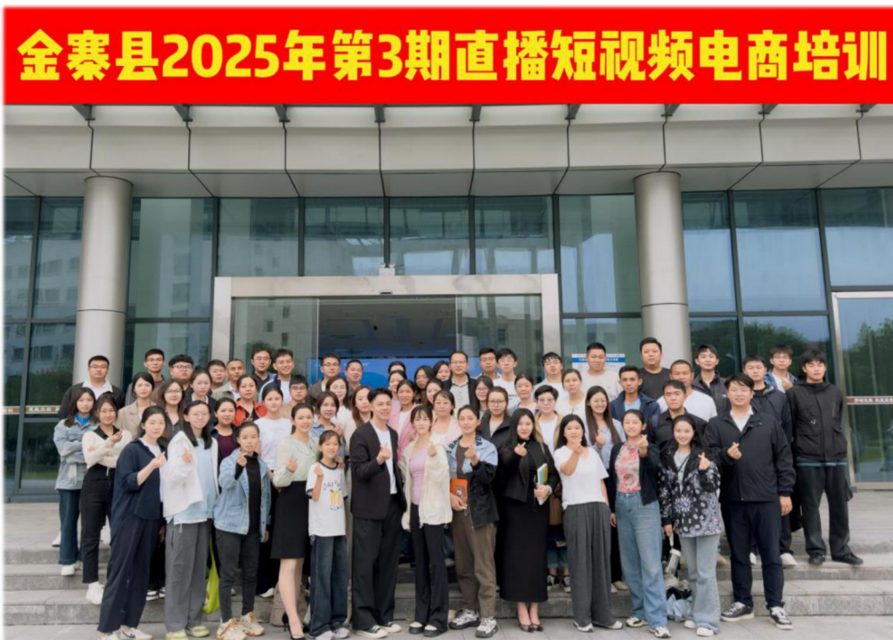
图 11 直播短视频电商培训班合影