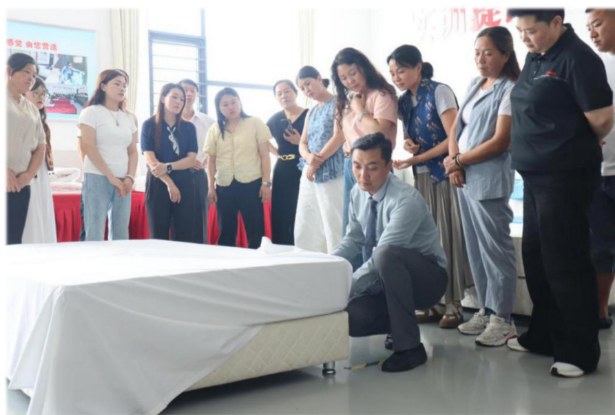
图 14 民宿管家培训班客房服务实操教学

升计划”。二是加强农村电商人才培育。在六安技师学院加挂“六安电子商务学院”牌子，许可8所民办培训机构开设“直播销售员”职业技能培训工种，面向新型农业经营主体、返乡农民工、高校毕业生、退伍军人、脱贫边缘户、脱贫村电商网点负责人等持续开展电商技能培训。将农村电商纳入就业技能培训工种目录，并按规定给予补贴。三是打造农民工劳务输出品牌。深化丁集婚纱小镇等产业品牌培育，优化产训结合；提质扩面“六嫂”家政等成熟品牌，推广“送技下乡大篷车”破解工学矛盾。同时，持续推进“新徽菜·名徽厨”行动，依托30家机构培训徽菜师傅2298人；举办“超级皖”美食争霸赛等活动，以赛促产提升品牌影响力。