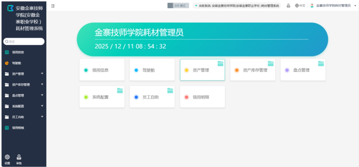
图 1安徽金寨职业学校耗材管理平台

实训耗材管理平台的建成改变了传统耗材管理的粗放模式，为学校教育教学与管理工作的有序开展提供了坚实的后勤保障，通过数字化技术成功助力学校管理提质增效。