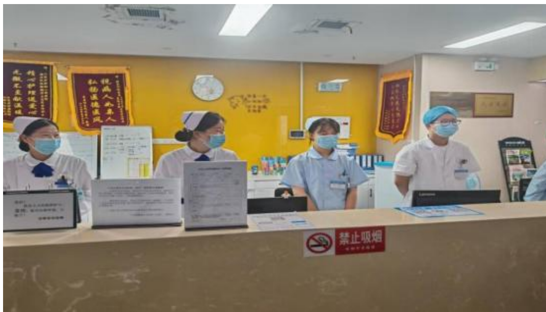
图 10 护理专业学生实习

积极发挥人才与专业优势，深度融入并服务地方发展。六安天河职业中专学校紧密对接地方需求，与政府、企业构建合作网络，为产业升级提供智力与人才支持，并通过参与公益事业增强社会影响力。皖西经济技术学校坚持“面向三农”，联合多部门创新探索出“政教结合”“培训+生产经营”等多元培训模式，其成果获国家级教学成果二等奖。金寨职业学校持续拓展社会服务，2025 年开展各类培训 44 期近 6000 人次，完成职业技能鉴定超 5400 人次，并积极组织公益培训，其毕业生留当地及中小微企业就业比例高，为区域产业发展稳定输送了技能人才。霍山职业学校紧扣高端装备制造、中医药大健康、光源电器、现代农业、现代服务业等产业谋划招商引资项目，该新校区（霍山职业学校就业创业产教融合共享实训基地）于 11 月正式开工建设，将进一步提升学校实训基础条件和能力。