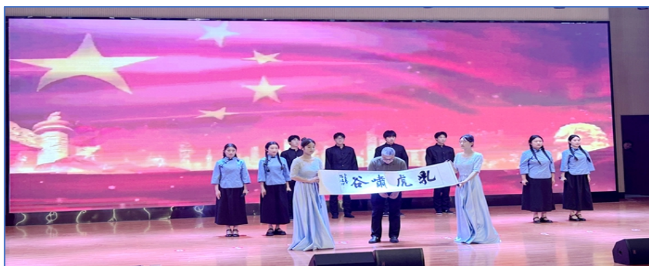
图 15 “墨香悠远 声诵蓼城”经典诵读活动

六安市积极落实省教育厅和六安市委、市政府要求，全面落实立德树人根本任务，组织各校通过开展校园文化艺术节暨、技能大赛、体育文化艺术节和其他丰富多彩的文化活动，开展工匠精神进校园、校企文化共建、师生书画展、唱红歌、中华经典诵读等，全面提升师生的综合素养和职业技能，弘扬劳模精神和工匠精神，营造劳动光荣的社会风尚和精益求精的敬业风气。一是举办“传承工匠心 共铸报国情”主题朗诵比赛活动，优选学生参加安徽省中职学校主题朗诵比赛获省级奖项4项。二是邀请大国工匠前往各校做成长成才报告，先后邀请4名大国工匠做报告，让学生零距离感受大国工匠非凡魅力。三是成立志愿者服务队，开展志愿服务，2025年各校先后组织学生进社区、进企业、进工厂开展志愿服务40余场次。四是组织开展校园文化艺术技能节和技能大赛，在大力培养高技能人才同时，充分展示学生发明创造及制作本领，让学生真正感受到劳动光荣、技能宝贵、创造伟大的深刻内涵。