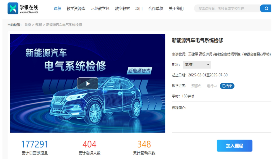
图 5 新能源汽车电器系统检修在线精品课程

例和技术，聘请企业人员来校授课等，增强教学的实践性和创新性。各校均建有自主在线学习平台和精品在线开放课程，具有线上教学测试、教学评价等功能，主干专业均有校级以上精品课程和网络课程，全市现有专业教学资源库 9 个，在线精品课程 71 门，在线精品课程课均学生数 1302 人。