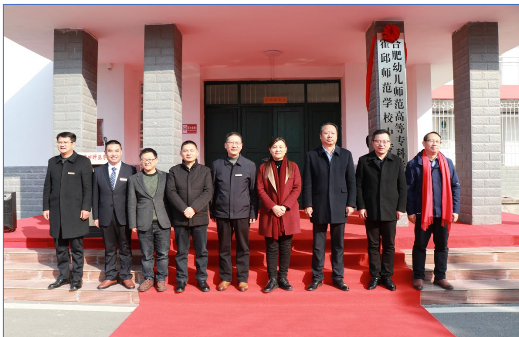
图 4 合肥幼儿师范高等专科学校与霍邱师范学校中专分校揭牌仪式

分校成功揭牌后，构建起高层次学前教育技能人才培养新模式，有效提升了本地人才培养质量，为学生成长成才搭建优质平台，助力地方经济社会发展。此次合作印证了校地协同是优化教育资源、服务区域发展的有效路径，坚守育人使命、优势互补方能实现双赢，为县域各类技能人才培养提供可借鉴的实践范式。