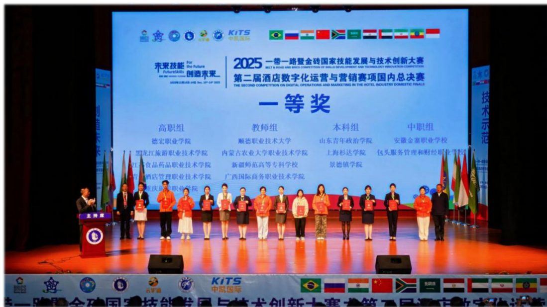
图 17 安徽金寨职业学校获“一带一路”酒店数字化运营与营销赛项国内总决赛一等奖

将国际化素养培育融入日常教学与师资发展。鼓励教师通过国内外知名在线教育平台、学术数据库，系统学习国际先进的职业教育理念与专业教学法。各校师生积极参与“一带一路”金砖国家技能大赛，鼓励学生在国际舞台上锻炼实践能力。安徽金寨职业学校 2025 年秋学期参加“一带一路”竞赛 6 个赛项获奖，其中一等奖 2 个。