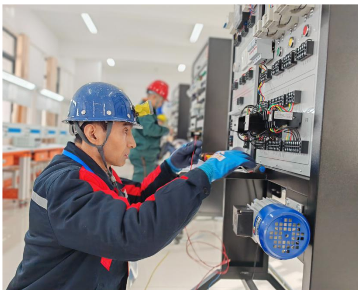
图 2 市级电工技能竞赛

式改革和人才培养模式改革，优化教学实训内容，培育“工匠精神”，“以赛促教、以赛促学、以赛促改、以赛促建，积极构建“学-建-赛-训”互促机制，学生技能水平不断提高。2025 年全市中等职业学校在省级、国家级技能大赛、教育教学技能竞赛、班主任能力大赛等省级及以上活动中获奖 76 个，其中一等奖 12 个，二等奖 29 个、三等奖 35 个。4 人荣获中等职业学校名校长培养计划人选，5 人荣获中等职业学校名师（名匠）培养计划人选。安徽金寨职业学校连续三年在安徽省职业院校技能大赛中获得中职组总分第一名。